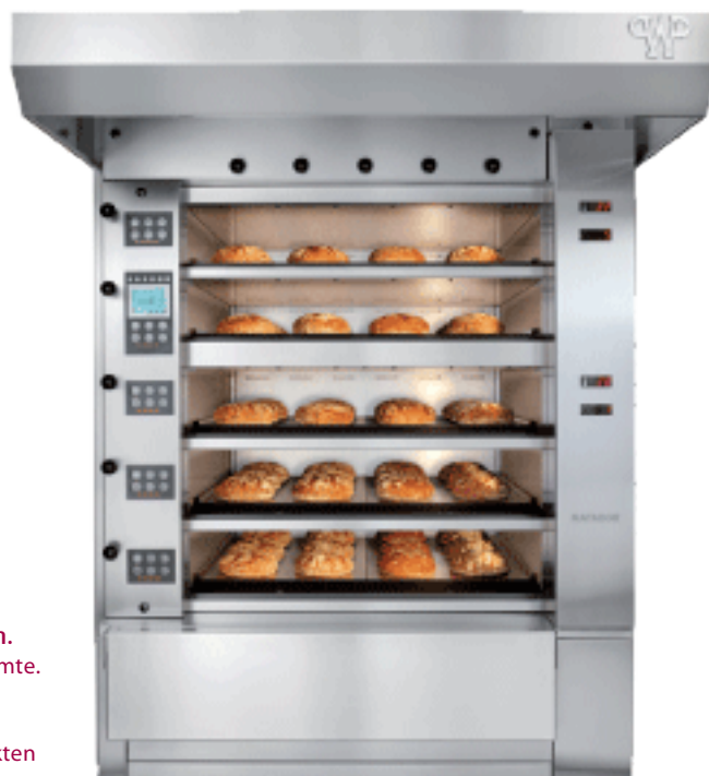
Foto: MATADOR uitgevoerd met opties.